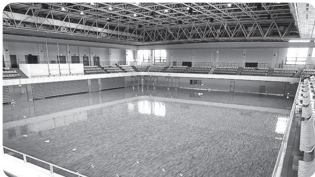
床を全面張替、照明設備をLED化し 明るくなったアリーナ

平成元年に完成し、多くの市民に親しまれてきました野洲市総合体育館が、令和7年開催の「わたSHIGA輝く国スポ・障スポ」の会場となるため、大規模な改修を行い、7月1日にリニューアルオープンします。