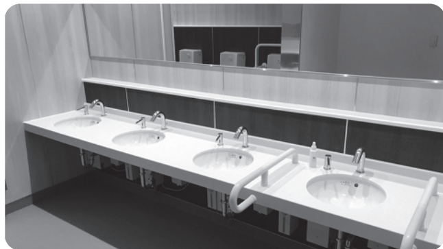
バリアフリー化し使いやすくなった 衛生設備