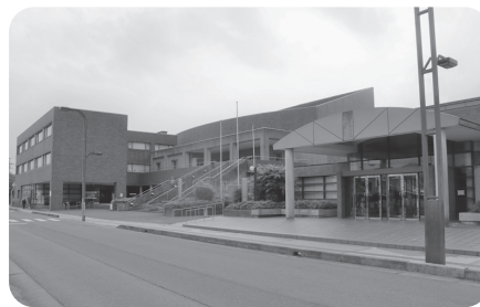
野洲文化ホール・野洲文化小劇場