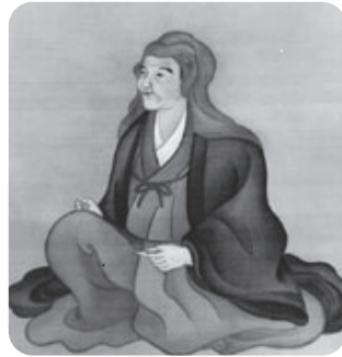
北村季吟 (1624～1705)

問い合わせ…北村季吟顕彰会 (文化スポーツ振興課内) ☎516-4568、FAX587-3835