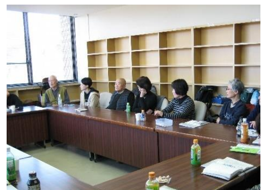
【野洲市健康福祉センターでの例会の様子】

野洲市内においてアルコール問題(アルコール依存症)対策の自助組織として発足しました。アルコール依存症という病気の理解とアルコール依存症は回復できる『病』であるという事を例会を通じて会員・市民にPRしアルコール問題で苦しんでいる方への支えとなる活動を行っています。毎週金曜日13:30～15:00野洲市健康福祉センターで活動をしています。また、会員は随時受付していますので興味のある方は是非ともご参加ください。