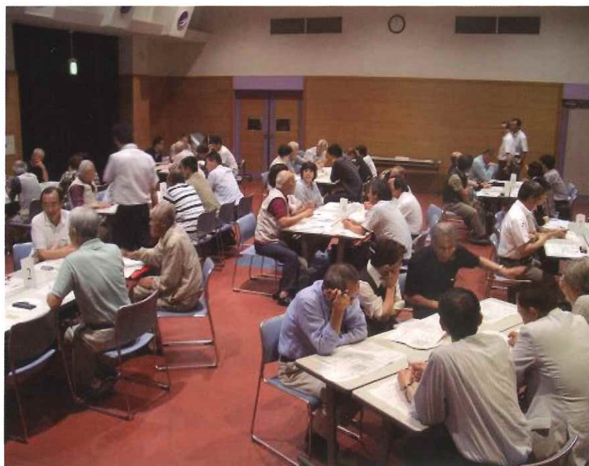
じんけんセミナーでの話し合い

要は、差別もいじめも、さまざまな場でみんなで話し合うことが、解決の早道ではないか ということです。みんなで日常的に『つどいあう場』が今、求められているのではないでしょ うか？ 『傍観者』ではなく、差別やいじめをなくす『関係者』になりましょう。