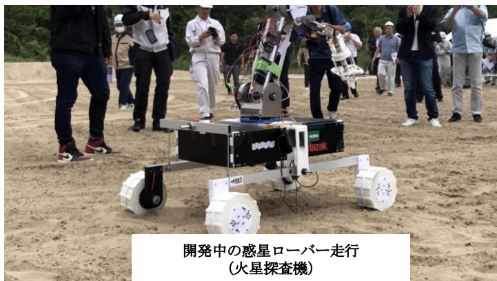
開発中の惑星ローバー走行 （火星探査機）

県立高等専門学校や地域企業と連携した 技術研修のフィールドとして活用 し、若手技術者の育成を図るとともに、地域が抱える課題解決のための高度技術の利活用を目指します。地域住民に身近な公園やコミュニティー活動の拠点となる公園などして整備するため、企業と連携した 清掃活動などの活動フィールドとして活用 します。