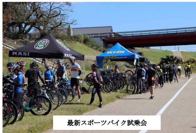
最新スポーツバイク試乗会