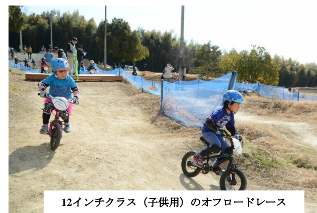
12インチクラス（子供用）のオフロードレース