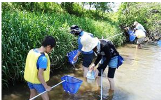
魚などの水辺の生きものや川についてご家族で楽しみながら学びます。

里山から野洲川、琵琶湖まで連続する豊かな自然環境が守れるまちを目指し、 動植物の生息・生育環境を保全・創出できる場として活用 します。