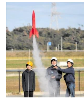
ロボットテストフィールド （模型ロケット打ち上げ）