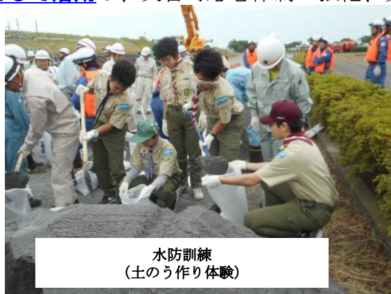
水防訓練 （土のう作り体験）

市民が日常的に災害へ備え、発災時に適切な行動ができるよう、地域住民、消防団、自主防災組織などと連携した 総合防災訓練会場として活用 し、災害時応急体制の強化、災害情報等伝達手段の充実を図ります。