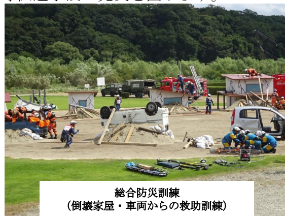
総合防災訓練 （倒壊家屋・車両からの救助訓練）