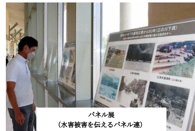
パネル展 （水害被害を伝えるパネル連）