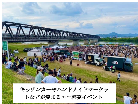
キッチンカーやハンドメイドマーケットなどが集まるエコ啓発イベント

野洲市ならではの体験や学びの情報発信、ニーズに対応する新たな観光資源の掘り起こしを進め、多くの人を訪れ、楽しめるまちを目指し、市民・団体・商工業者・観光事業者等と連携した 定期的なイベントの開催等、地域資源を活用した観光振興の場として活用 します。