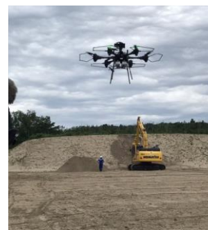
建設技術実証フィールド （ドローン自律飛行の実演）