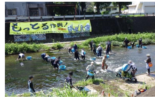
肝属川河川内の清掃（外来種の藻取り、ゴミ拾い）を行い、肝属川の水質改善