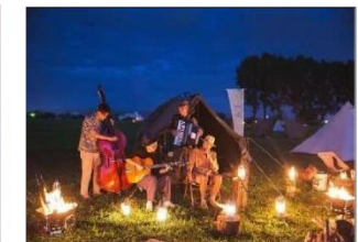
MIZBEステーションを拠点とした各種イベント実施例