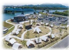
賑わい拠点の整備 (木曾川/美濃加茂市)