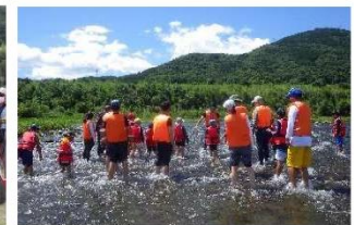
MIZBEステーションを拠点とした自然体験活動例