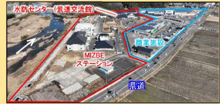
民間商業施設と隣接