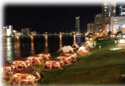
民間事業者の参加 (信濃川/新潟市)