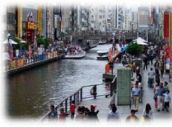
遊歩道の民間活用 (道頓堀川/大阪市)