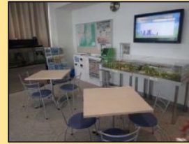
防災啓発コーナー