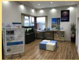
水防多目的センター