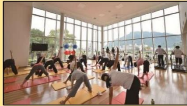
運動・教室スペース(エクササイズ)