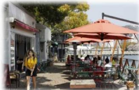
オープンカフェの設置 (京橋川/広島市)