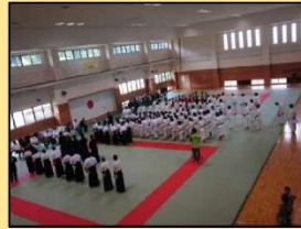
水防センター(武道交流館)