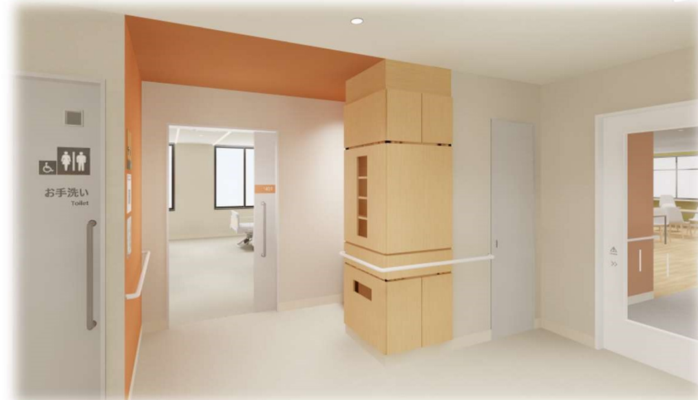
⑧ 4階 4床室前