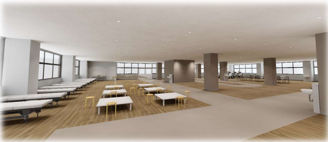
⑪ 6階 リハビリ部門