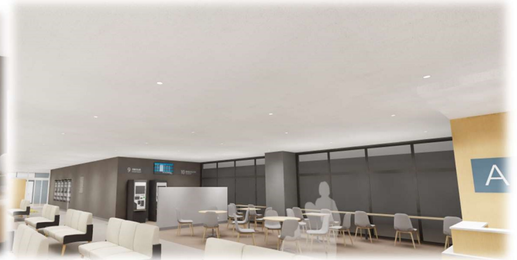
②1階 右【患者ラウンジ イートインコーナー】