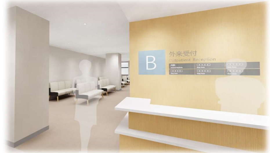
⑥ 2階 外来受付