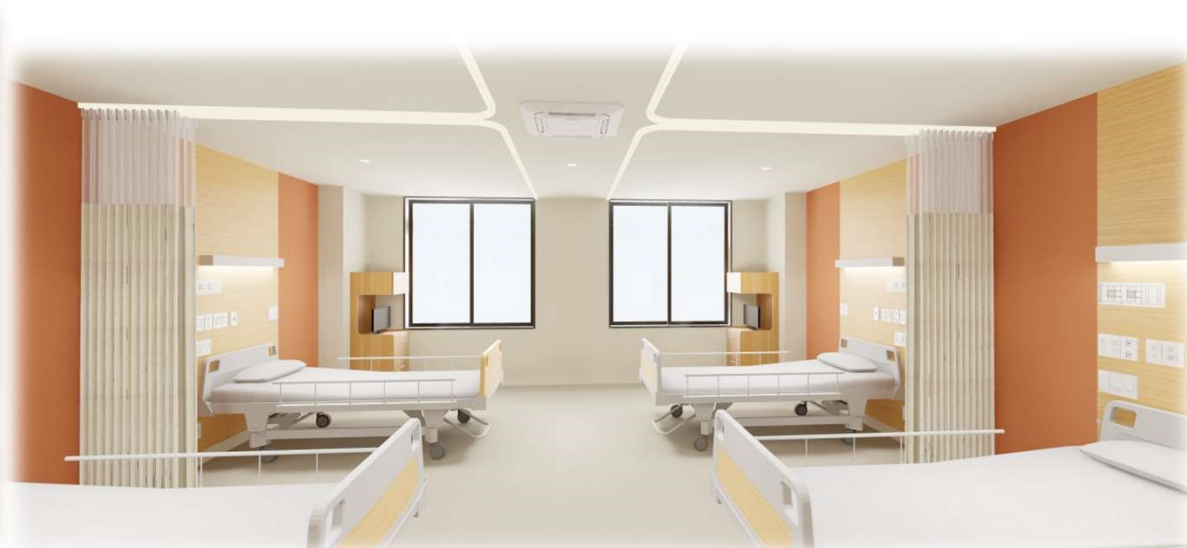
⑩ 4階 4床室