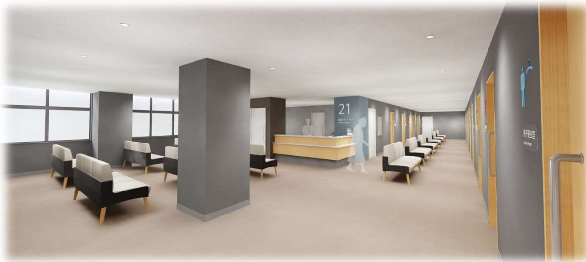
⑤ 2階 健診待合ホール