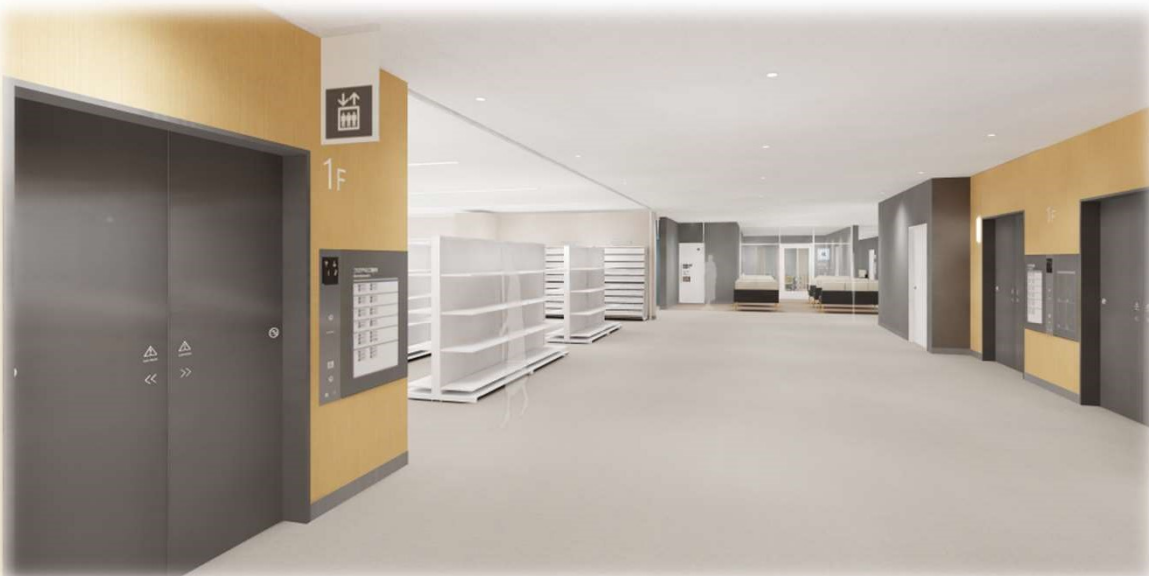
③1階 左【外来用エレベータ（1基）、売店】 右【エレベータ（2基）】