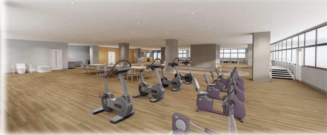
⑫ 6階 リハビリ部門