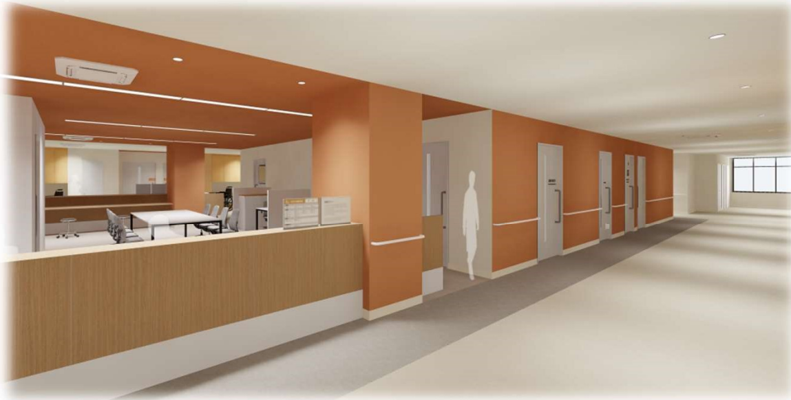
⑦ 4階 スタッフステーション前