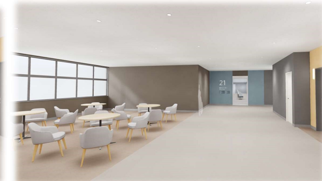
④2階 外来ラウンジ （奥の扉より健康管理センターへ）