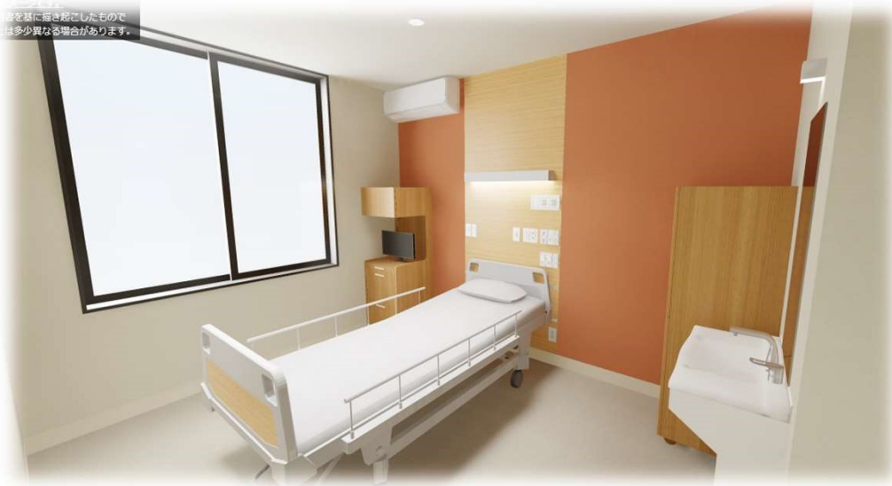
⑨ 4階 個室