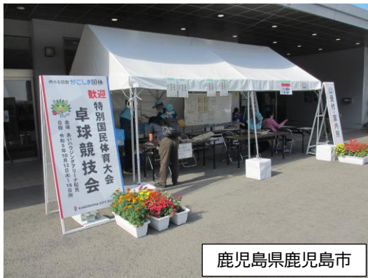
鹿児島県鹿児島市

といった状況が見られ、歓迎装飾としての意味を成していないことを確認しました。実際に運営を行っていた先催県市町担当者からも効果を疑問視する意見をお聞きしたほか、佐賀国スポでは、県全体で「花いっぱい運動」に取り組まないこととされています。