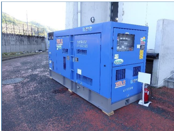
売店営業用インバーター発電機(バスケット)