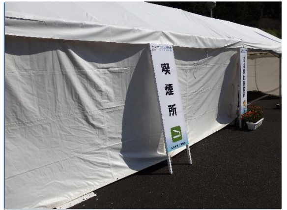
仮設喫煙所(バスケット)