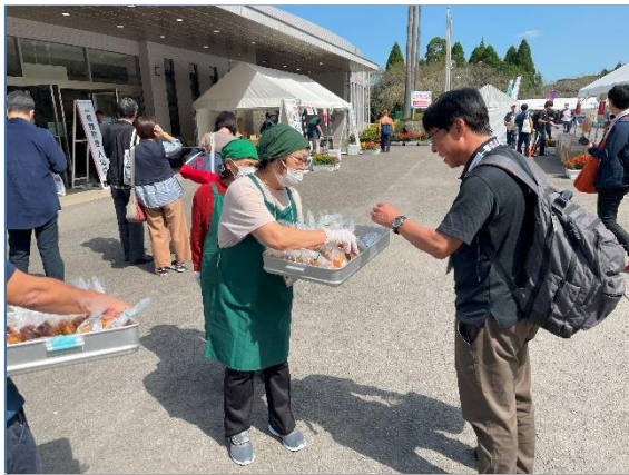
ふるまい品配布の様子(卓球競技)