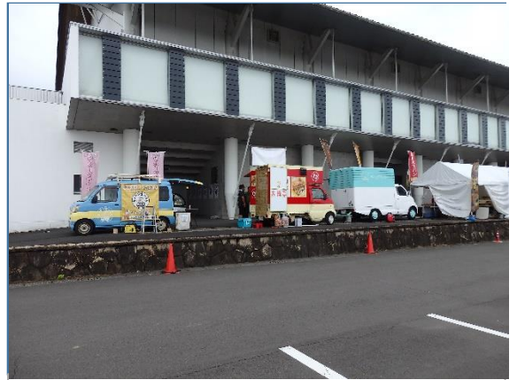
売店営業の様子(バスケット)