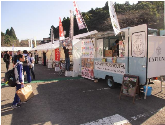
売店営業の様子(卓球競技)