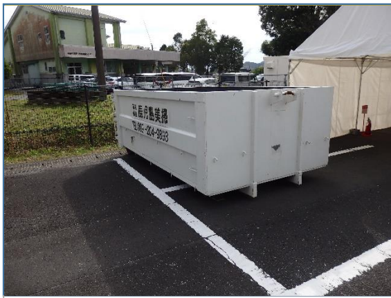
ゴミ収集コンテナ(バスケット)