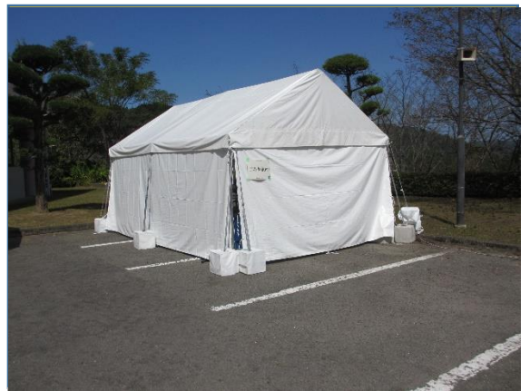
ゴミ集積所(卓球競技)