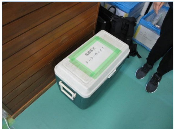
救護室クーラーボックス(卓球競技)