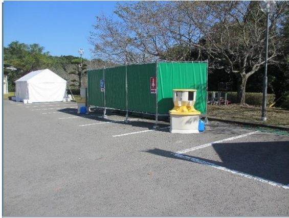
仮設トイレ(卓球競技)