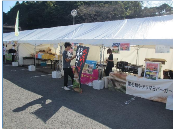
売店営業の様子(卓球競技)