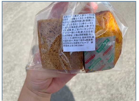
ふるまい品(黒糖人参ケーキ・卓球競技)