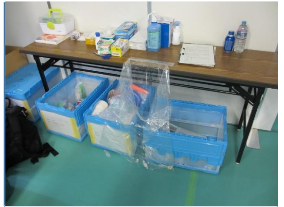
救護室内備品(卓球競技)