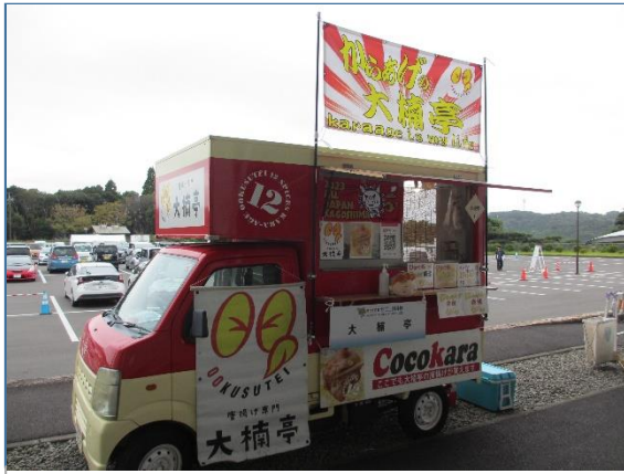
売店営業の様子(バスケット)