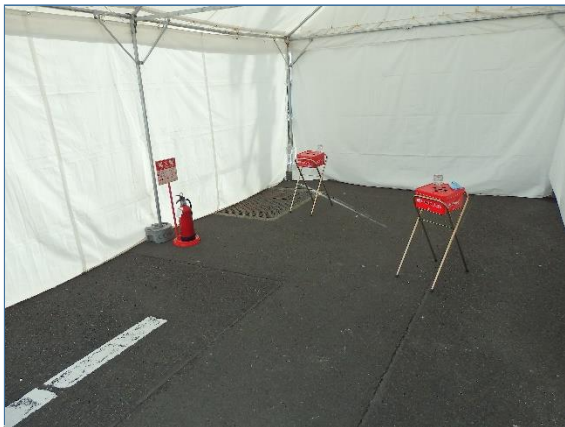
仮設喫煙所内部(バスケット)