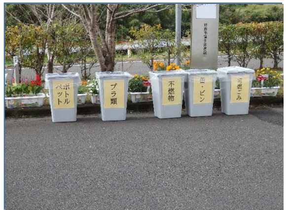
会場設置のゴミ箱(バスケット)