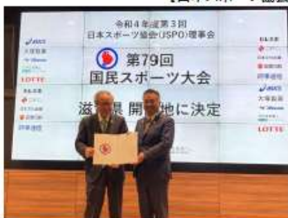
左:日本スポーツ協会 伊藤会長 右:滋賀県 三日月知事