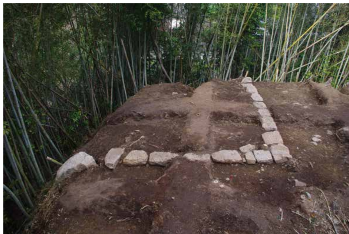
本丸「乾角御矢倉」の礎石列