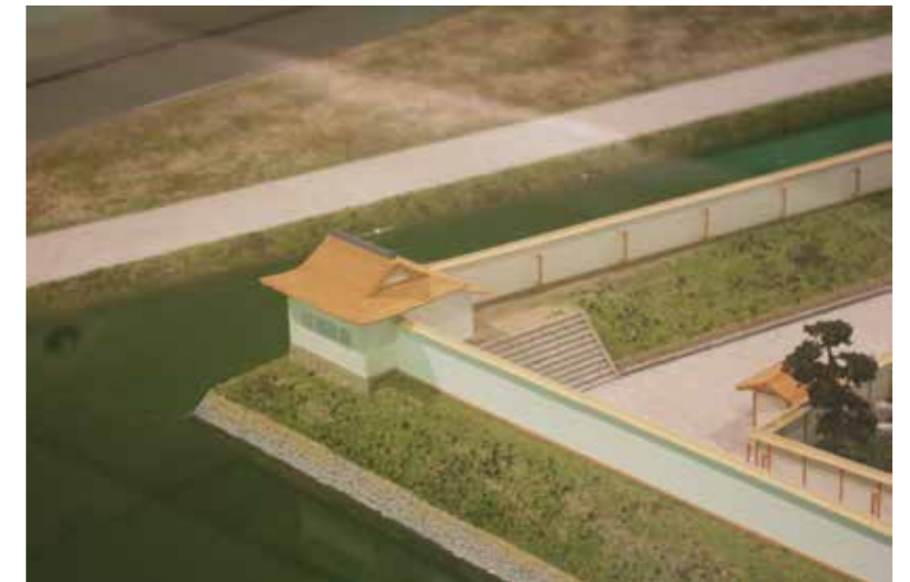
永原御殿復元模型 (野洲市歴史民俗博物館常設展示) の本丸「乾角御矢倉」