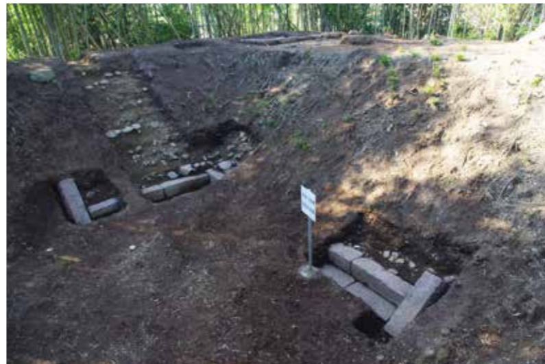
雁木の最下段と耳石の検出状況