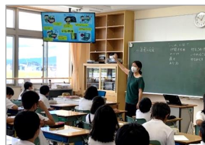
スクールロイヤーによるいじめ防止授業