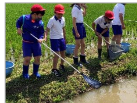
まん中の深いところへ 網をゆっくりゆっくり！