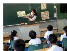
読み語りボランティアさんの 朝の読み聞かせに夢中!