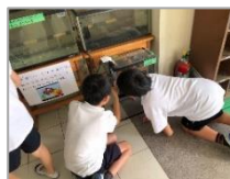
今日も元気そう！かわいいな

小さい魚はびわ湖にいるとあぶないから、田んぼで育てていることを知ってすごいと思いました。ゆりかご水田に行けてとてもうれしくて楽しかったです。