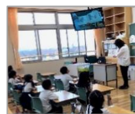
モニターに絵本を写して 1年生の読み聞かせ