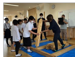
くぎ付け！ ケーキづくりの実演と 家を組み立てる実演と…