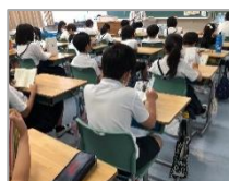
オルゴールが鳴ると 毎昼読書タイム