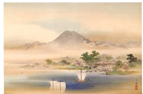
近江八景図(矢橋帰帆)からの三上山