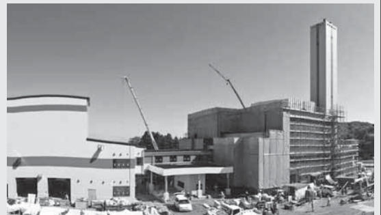
建設中の新野洲クリーンセンター

問い合わせ…野洲クリーンセンター整備室☎588-0568、FAX586-2150