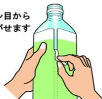
はがし口のあるラベル