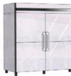
業務用冷凍冷蔵庫