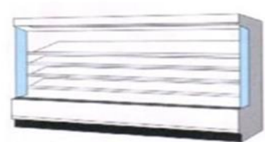
冷凍冷蔵ショーケース