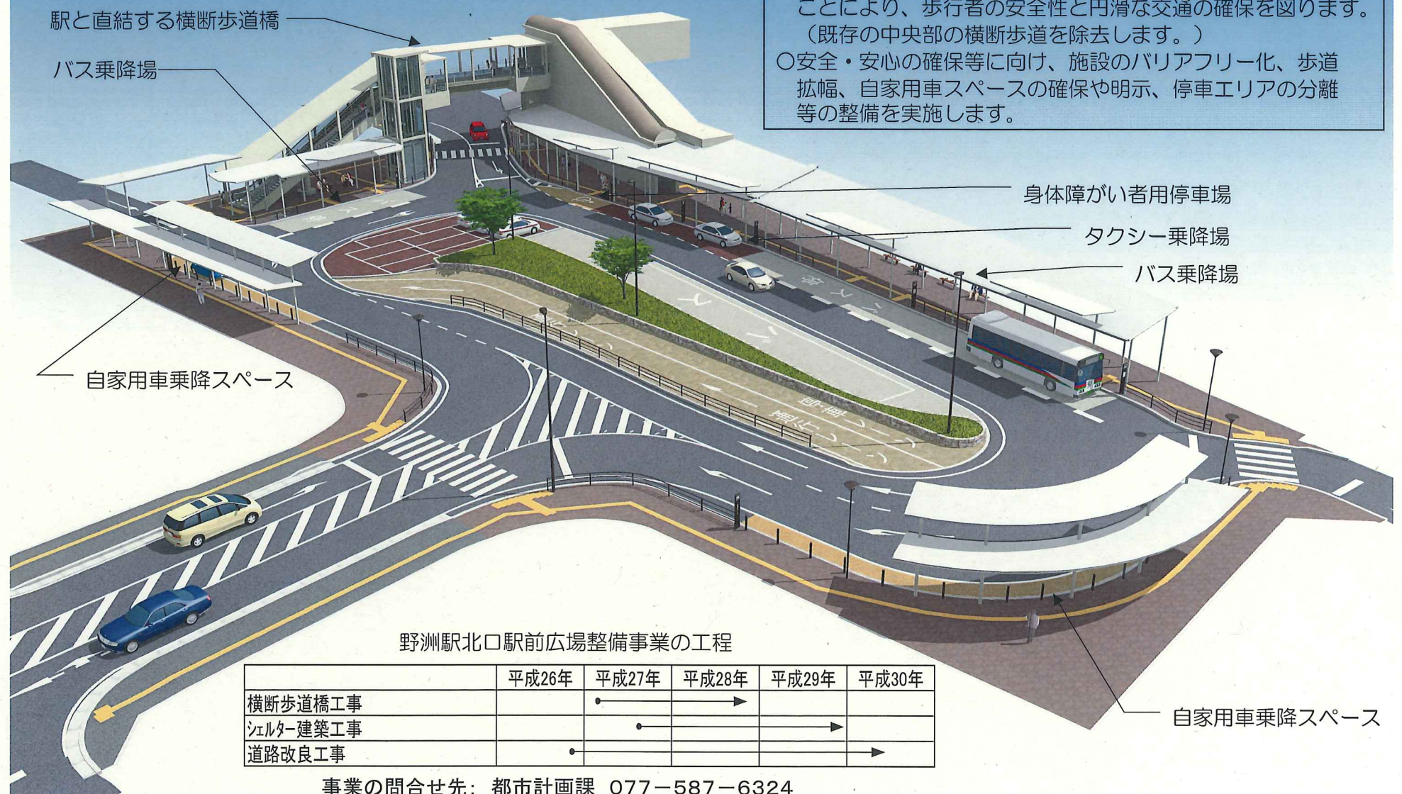
野洲駅北口駅前広場整備事業の工程

計画の基本的な考え方 ○横断歩道橋を整備し、歩行者主動線と車両主動線を分離することにより、歩行者の安全性と円滑な交通の確保を図ります。(既存の中央部の横断歩道を除去します。) ○安全・安心の確保等に向け、施設のバリアフリー化、歩道拡幅、自家用車スペースの確保や明示、停車エリアの分離等の整備を実施します。