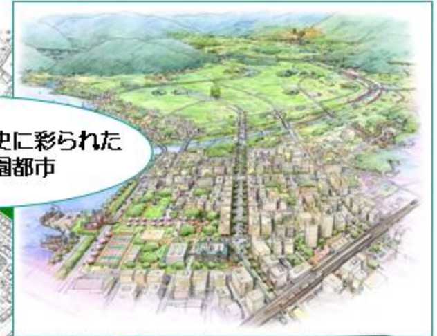
美しい水・緑と歴史に彩られた 心かよう庭園都市

【緑のボリュームアップ】 市街地に優先して緑が 求められるエリア (駅を中心として半径約1km)