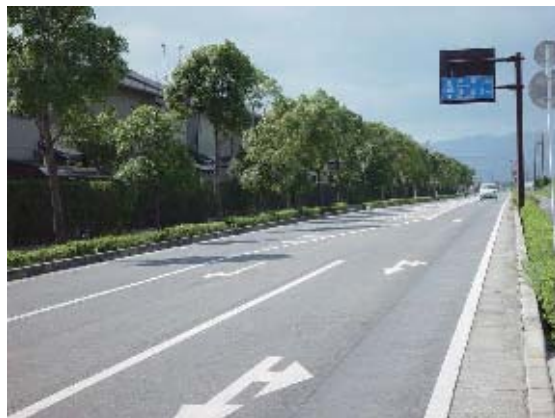
【主要地方道近江八幡守山線】