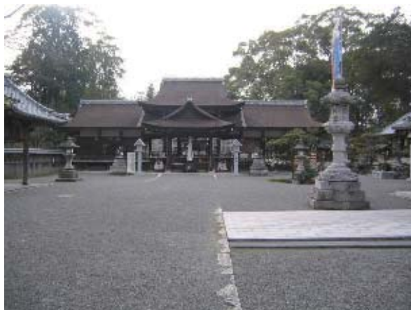
【地域の象徴となる兵主神社】