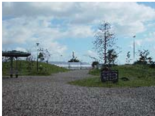
【吉川ふるさと公園】