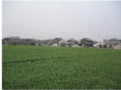
【地域一帯に広がる優良農地】