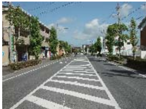
【市道乙窪比留田線沿道】