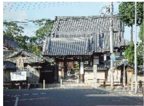
【真宗木辺派本山錦織寺】