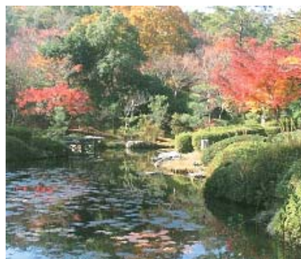
【滋賀県希望が丘文化公園内の日本庭園】

また、三上山をはじめとする山々から、琵琶湖岸、野洲川等の水辺、農村集落や河川、里山等を含めて美しい日本の原風景を構成する田園、さらには住宅