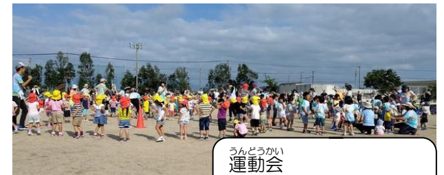
うんどうかい 運動会 いっしょ たいそう!! みんなで一緒に体操!!

ひとり たんじょうび たんじょうかい *一人ひとりの誕生日に誕生会をし ています。