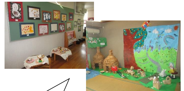
えんないさくひんでん 園内作品展 えんじぜんいん さくひん えんない てんじ 園児全員の作品を園内に展示 しています。