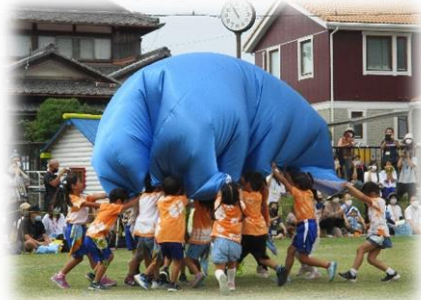
うんどうかい 運動会