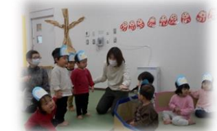
せいかつはっぴょうかい 生活発表会