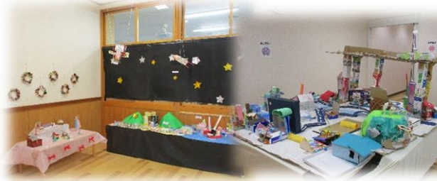
えんないさくひんてん 園内作品展