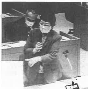
パネルを示し質問する野並市議(12月4日)