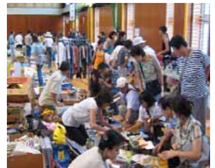
フリーマーケット会場の様子

みなさんも地球にやさしい『ECOフリーマーケット』にご参加してみたいかがでしょうか